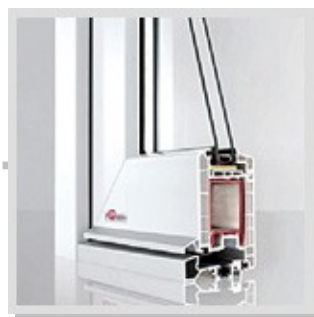
• REHAU Brillant Design

Vchodové dveře z profilů REHAU Brillant Design jsou velice stabilní, dobře tepelně a hlukově izolují. Plastové dveře z profilů Rehau Brillant Design vykazují velmi dobrou těsnost a nejsou nijak náročné na údržbu. Plastové dveře Rehau Brillant Design mají moderní design, vysoce hodnotné povrchové zpracování a mnoho možností při výběru barev a dekorů.